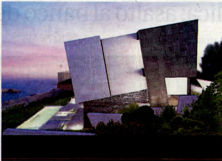
Plano de una de las viviendas, con el puerto de Luanco al fondo.

Los singulares edificios que conformarán el complejo residencial situado en la finca Quinta de San Roque de Peroño permitirán