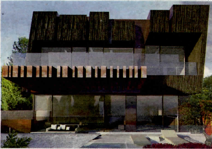
Exterior de una de las casas proyectadas en Peroño.

ampliar el desarrollo de este barrio, que comenzó a crecer urbanísticamente a mediados de los noventa, en pleno "boom" del sector de la construcción. En casi todos los casos, con viviendas unifamiliares que se asoman sobre Luanco.