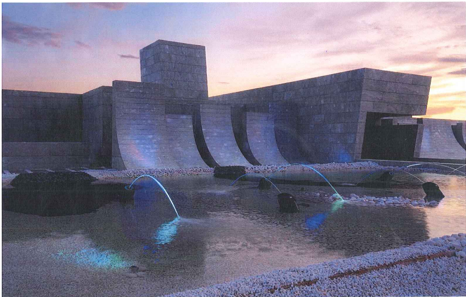
Nombre del Proyecto: Vivienda Unifamiliar 1001. Ubicación: Madrid, España. Arquitecto: A-cero, Joaquin Torres Architects / Joaquín Torres (director). Arquitecto Socio: Rafael Llamazares. Promotor: Privado. Jardinería y Paisajismo: A-cero / Viveros Alajarín. Constructora: OOC. Obras y Otras cosas s.l. Interiorismo: Propiedad y A-cero in.