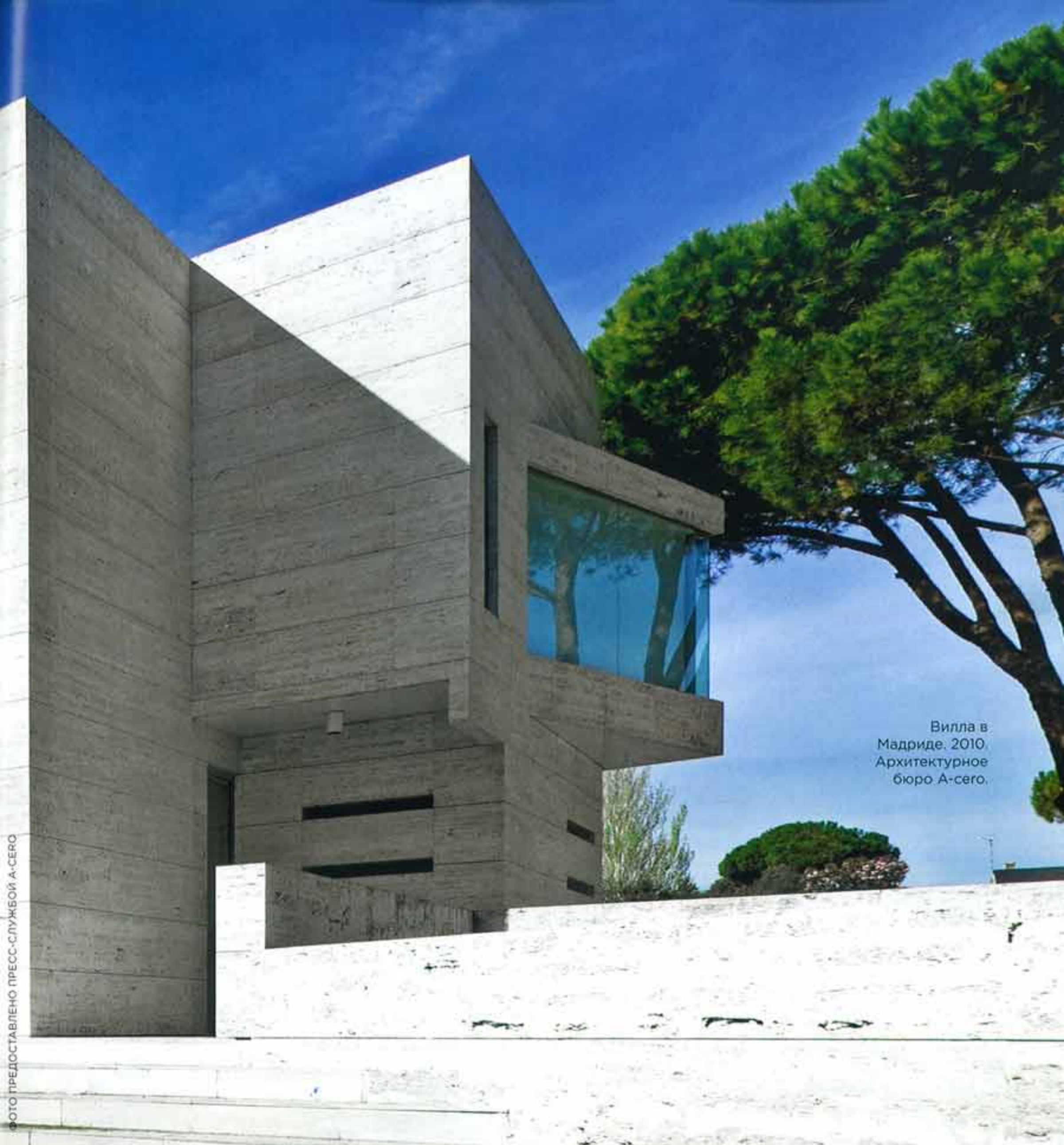
Вилла в Мадриде. 2010. Архитектурное бюро А-сего.