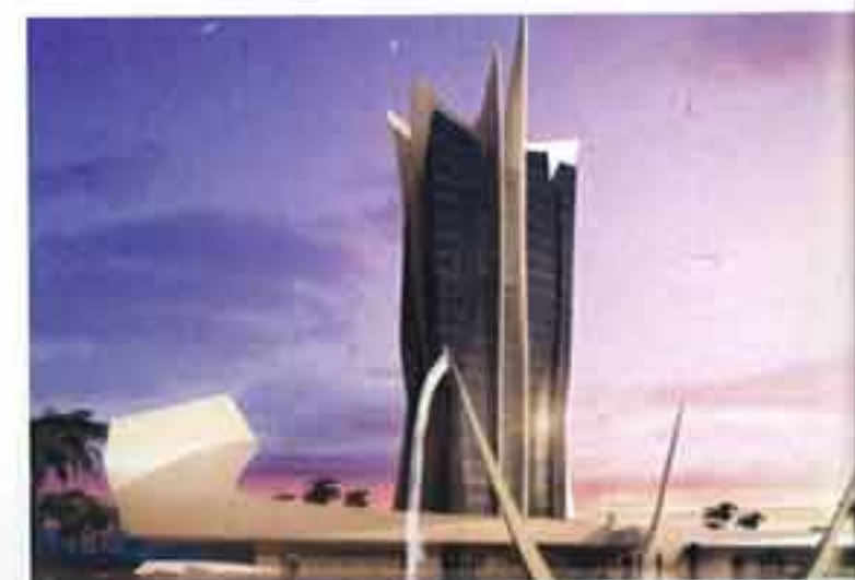
A la derecha, desde arriba: el Hotel Sisi y el proyecto The Heart of Europe , ambos en Dubai, y la Torre Norte de la ciudad de Murcia.