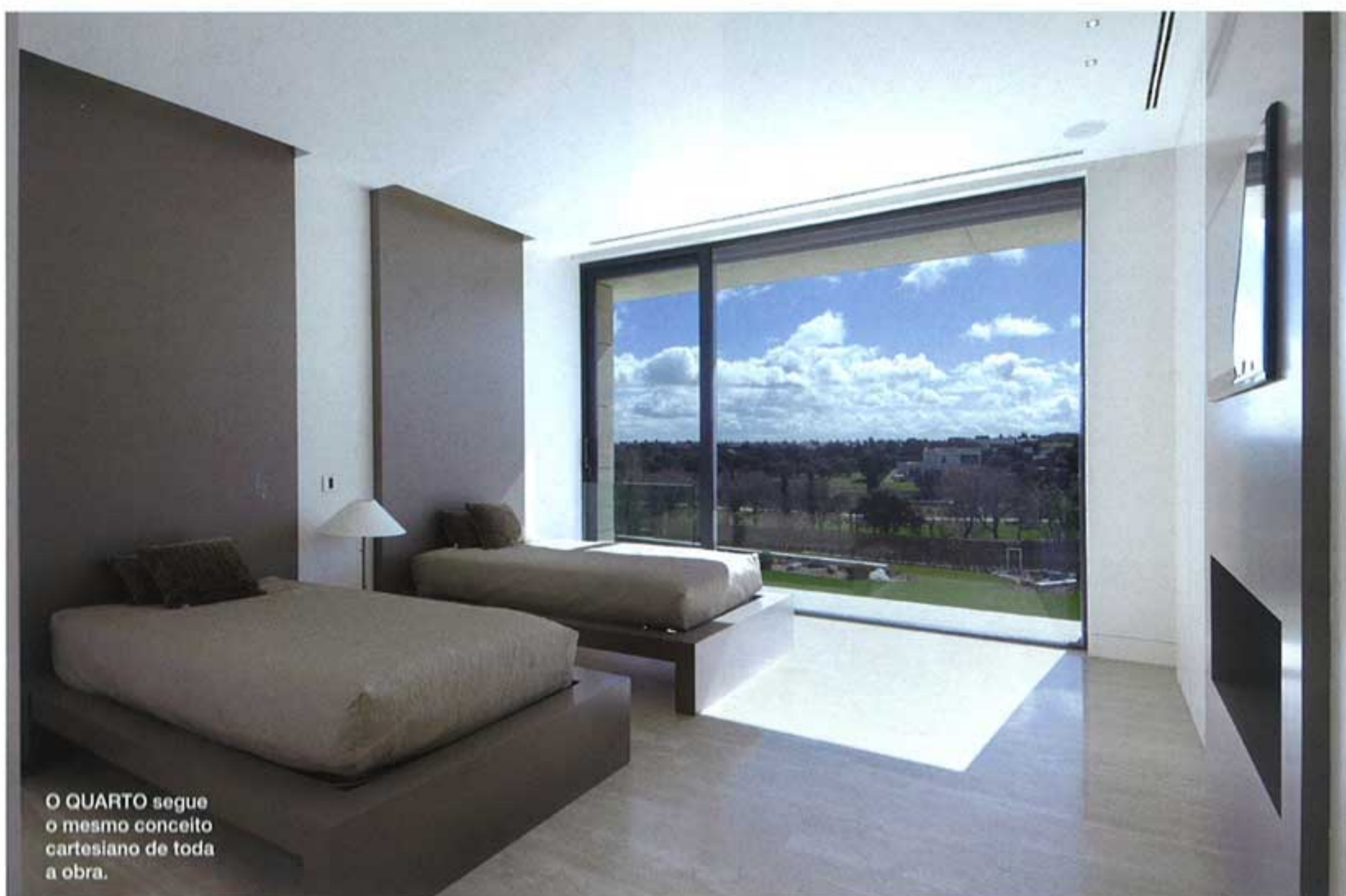
O QUARTO segue o mesmo conceito cartesiano de toda a obra.