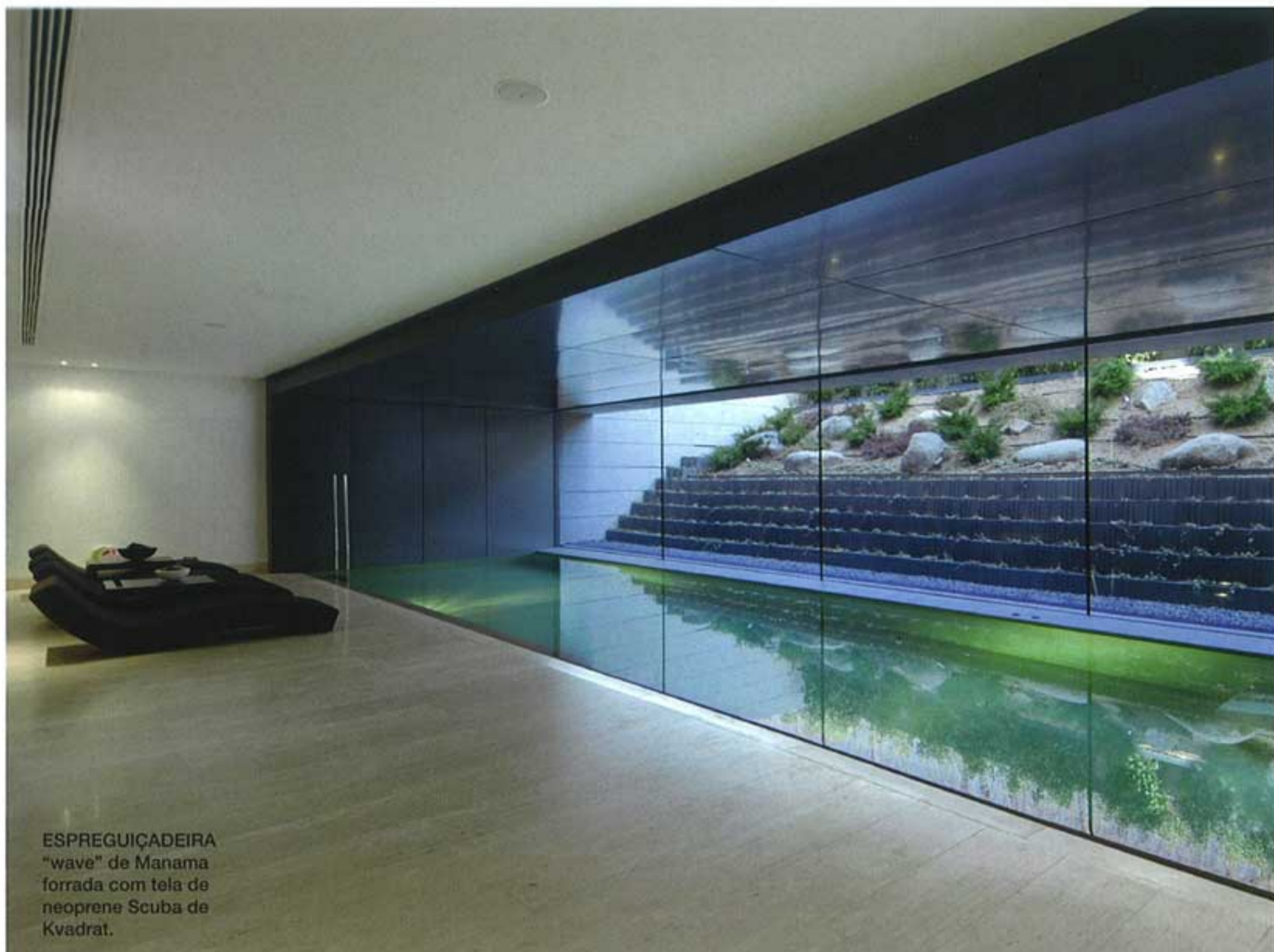
ESPREGUIÇADEIRA "wave" de Manama forrada com tela de neoprene Scuba de Kvadrat.