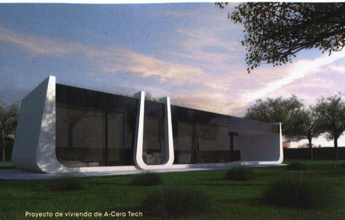
Proyecto de vivienda de A-Cero Tech