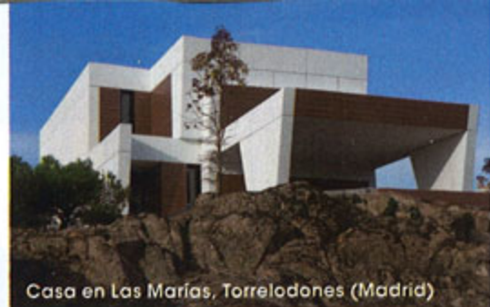
Casa en Las Marías, Torrelozanes (Madrid)

Hay tres modelos básicos de casas, de 85 a 230 m 2 , y desde 89.900 € hasta 248.000 € (el terreno no está incluido), tel. 917 99 79 84, www.a-cero.com .