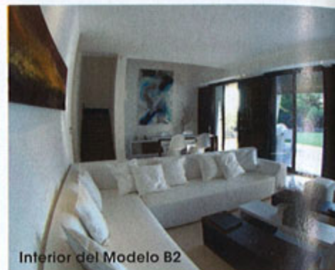
Interior del Modelo B2