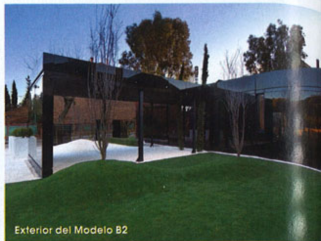
Exterior del Modelo B2

Hay tres modelos básicos de casas, de 85 a 230 m 2 , y desde 89.900 € hasta 248.000 € (el terreno no está incluido), tel. 917 99 79 84, www.a-cero.com .